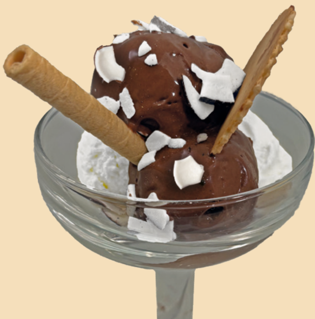
COCCOLOSA GELATO AL COCCO GELATO AL CIOCCOLATO SCAGLIE DI COCCO