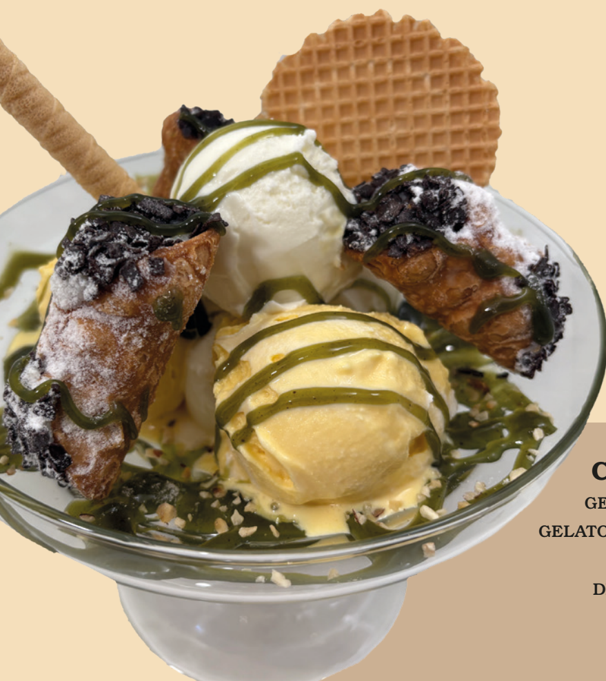
COPPA SICILIA GELATO AL PISTACCHIO GELATO ALLA CASSATA SICILIANA CANNOLI RIPIENI DI CREMA DI RICOTTA