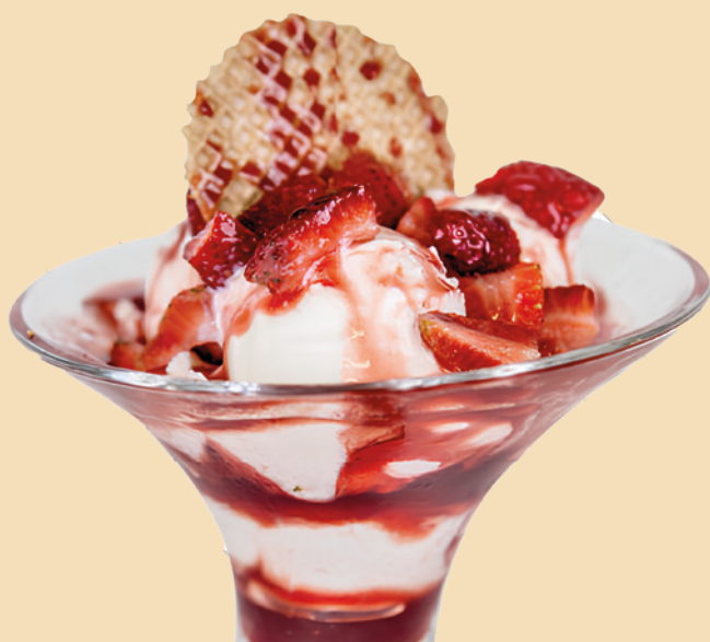
YOGURT FRESCO E FRAGOLE