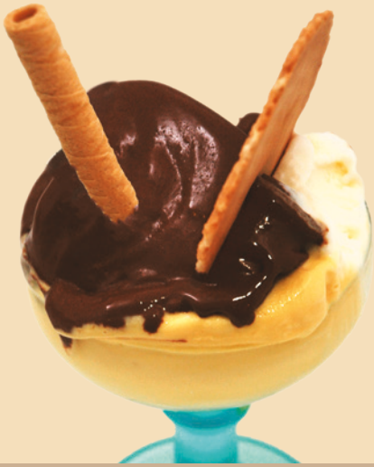
COPPA PICCOLA GUSTI A SCELTA 6,00 €