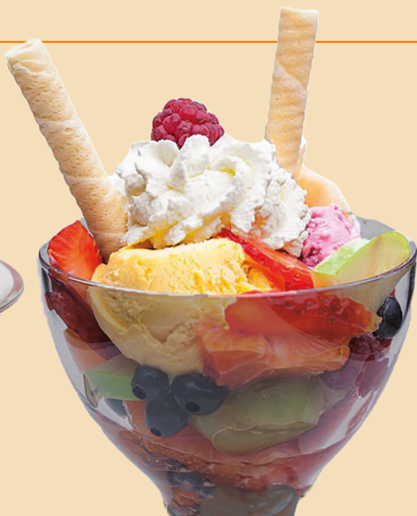
MACEDONIA CON GELATO