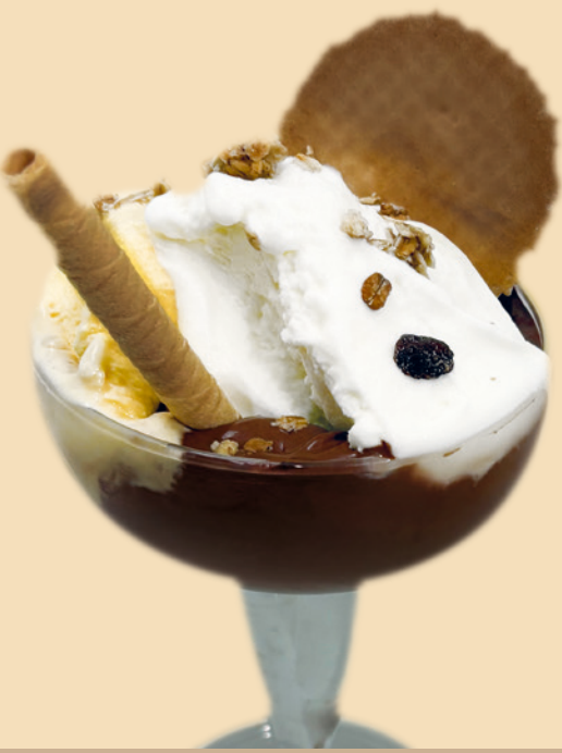
COPPA GRANDE GUSTI A SCELTA 9,00 €