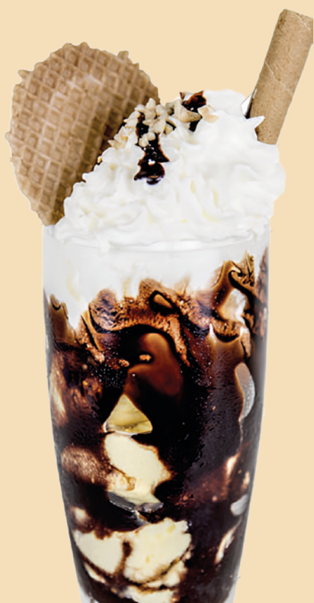
AFFOGATO AL CAFFÈ

GELATO ALLA CREMA CAFFÈ ESPRESSO PANNA MONTATA