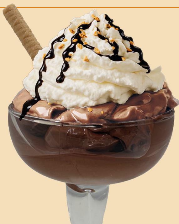
COPPA NUTELLONA GELATO NUTELLA PANNA MONTATA